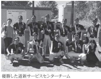
優勝した道新サービスセンターチーム

は、準決勝で道新サービスセンターに惜敗。もう一方のトーナメントでこのインサイト。激しい試合を制しつづつ決勝へ進出し道新サービスセンターとの決勝に駒を進めました。決勝戦は4回裏で1-3という道新サービスセンターの一方的な試合運びでしたが、インサイトが5回の表に一番8点の大量得点を挙げ食い下がったものの結果は14-11で道新サービスセンターが逃げ切り優勝を勝ち取りました。